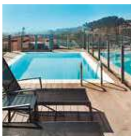
BARCELONA Catalonia Park Güell

Pº de la Mare de Déu del Coll, 10 Tlf: +34 932 19 12 04