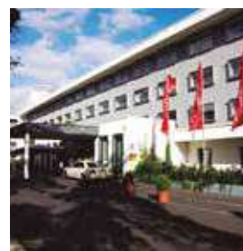
FRANKFURT Intercity Airport

Am Luftbrückendenkmal 1 Tlf: +49 69 697099