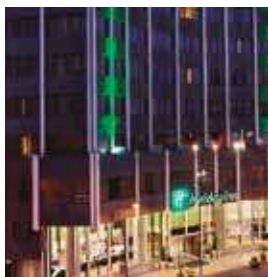
LISBOA Holiday Inn Lisbon

Tv. do Conde da Ponte, 1300-141 Tlf: +351 21 360 5400