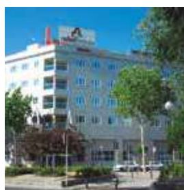
MADRID Rafael Atocha

4 Rue Reine Astrid Tlf. +33 5 62 41 41 41