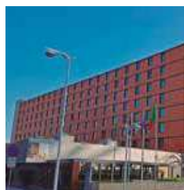
LISBOA Vila Galé Ópera

Am Luftbrückendenkmal 1 Tlf: +49 69 697099