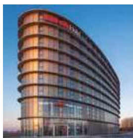
AMSTERDAM Intercity Airport