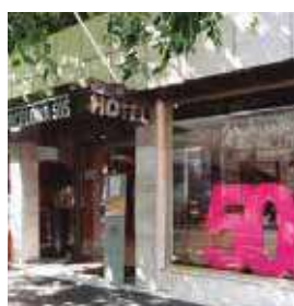
BARCELONA Catalonia 505

Pº de la Mare de Déu del Coll, 10 Tlf: +34 932 19 12 04