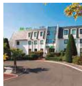
BURDEOS Ibis Styles Airport

Pl. d'Europa, 50-52 Tlf: +34 932 61 80 00