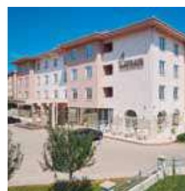
MEDJUGORJE Medjugorje & Spa

C. de Antonio López, 65 Tlf.: +34 914 69 06 00