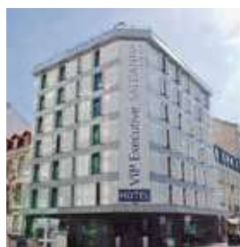
LISBOA Vip Saldanha

Av. António José de Almeida 28 Tlf: +351 21 004 4000