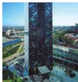
BARCELONA Renaissance Fira

Pl. d'Europa, 50-52 Tlf: +34 932 61 80 00