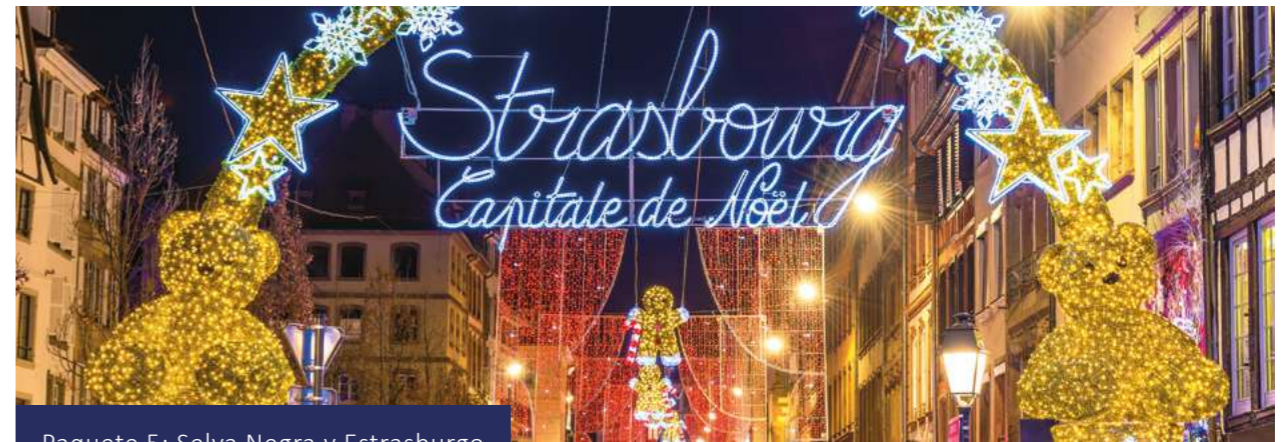
Paquete 5: Selva Negra y Estrasburgo

Si hay suficiente tiempo, puede visitar opcionalmente el mercado de Navidad en Esslingen, famoso por ofrecer un ambiente medieval muy especial. Traslado privado opcional al aeropuerto.