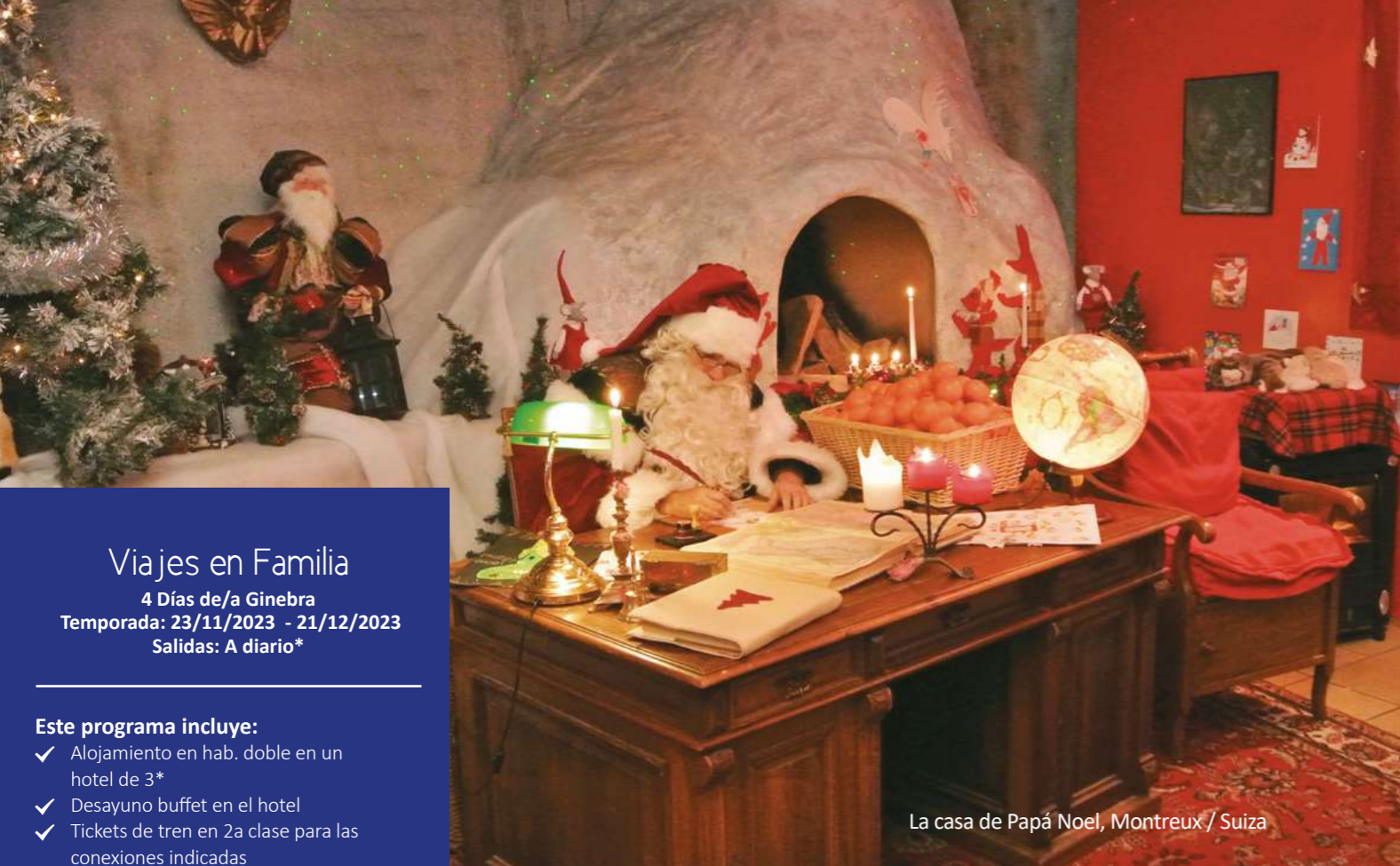
La casa de Papá Noel, Montreux / Suiza