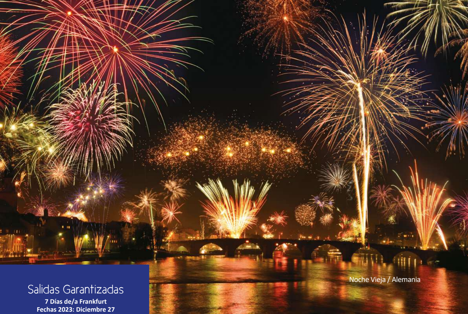
Noche Vieja / Alemania

Salidas Garantizadas 7 Días de/a Frankfurt Fechas 2023: Diciembre 27