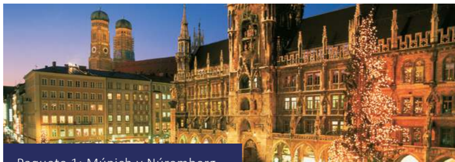
Paquete 1: Múnich y Núremberg