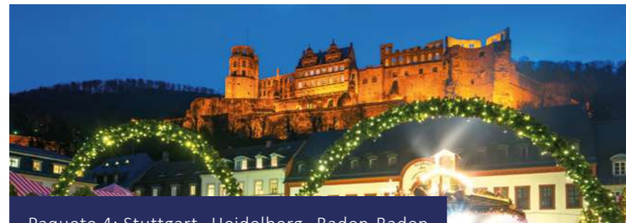
Paquete 4: Stuttgart- Heidelberg- Baden-Baden