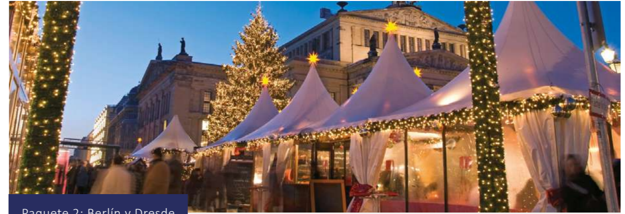
Paquete 2: Berlín y Dresde

Traslado privado opcional al aeropuerto.