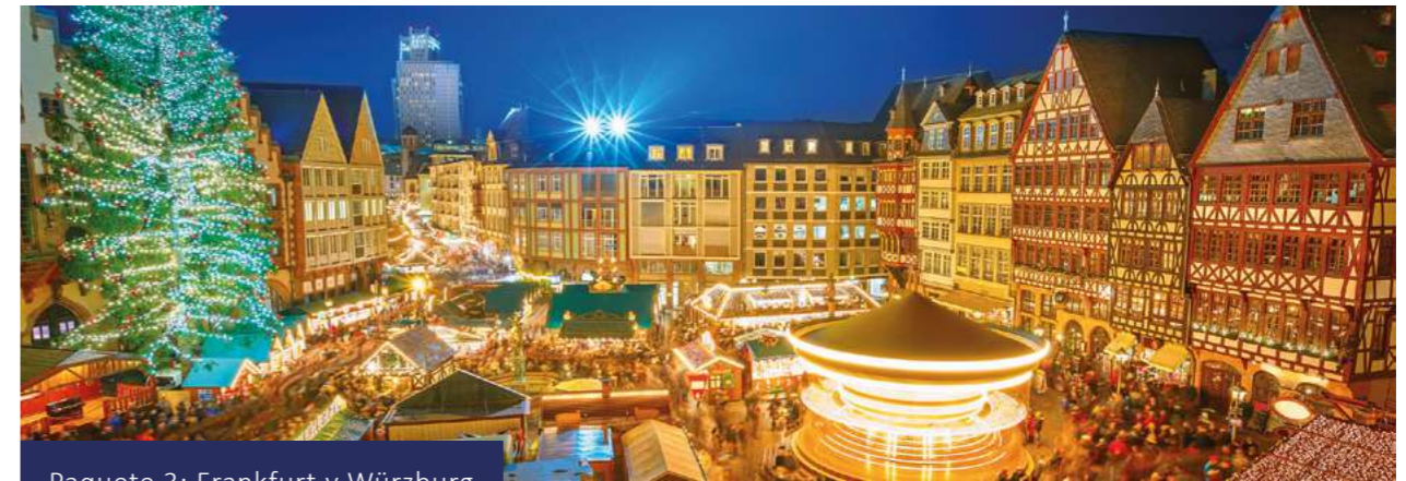
Paquete 3: Frankfurt y Würzburg

Traslado privado opcional al aeropuerto.